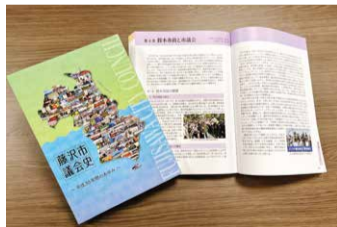
藤沢市議会史(記述編)