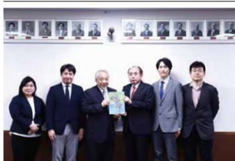
監修者と執筆者の先生方

令和元年10月から編さんを進めてきた平成30年間の藤沢市議会史が完成しました。この議会史に記録されている30年間は、湘南なぎさシティ構想の中止、ダイオキシン流出問題、百条委員会の開催など、センセーショナルな事柄や、議会基本条例の制定、議会のICT化など、時代を反映し、発展してきた議会の様子が盛り込まれています。読みやすく、手に取りやすい議会史を目指し、時代にあった議会史を模索し、完成させたものです。