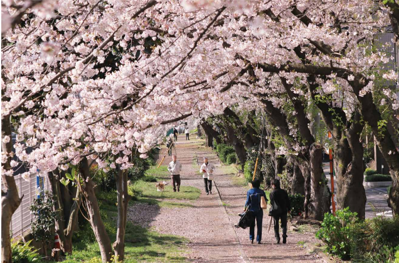
花便りに誘われ散歩を回り道 境川大道橋付近