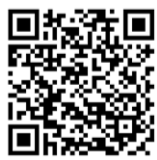
▲市議会HP 議会史のページへ