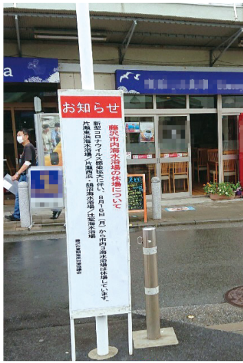
来夏に向けて市民が安心できる海水浴場を目指す

答弁 本年は県カイドライオンを基に各組合が開場を決定した後、感染急拡大を受け、各組合に対して海水浴場の休場を要請したが、決