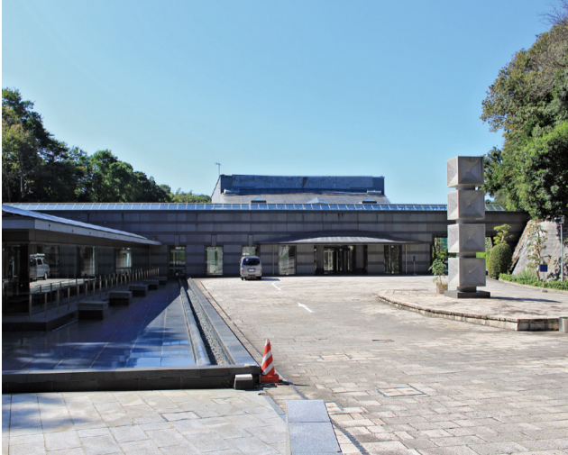
残骨灰有価物の適切な処理が求められる=藤沢聖苑