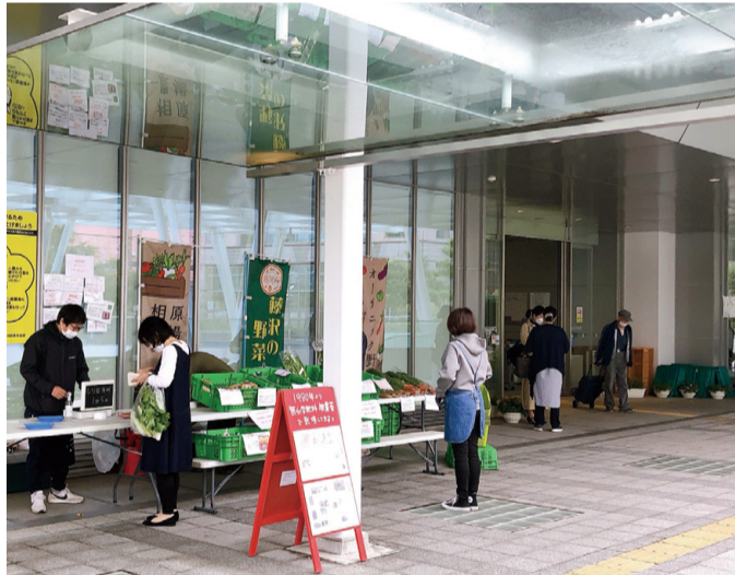
サンセットマルシェ等を活用し有機農業の理解につなげる

回答 本市の有機農業の割合は2%程度のため、25%にするには、令和3年度5月にみどりの食料システム戦略を策定した。化学肥料を削減し、2050年までに有機農業の取組面積を全耕地面積の25%にすることを目標としている。本市としても取組を進める必要があると考えるが、市の見解を聞きたい。