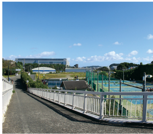
請願時とは村岡新駅を取り巻く状況も遷移している