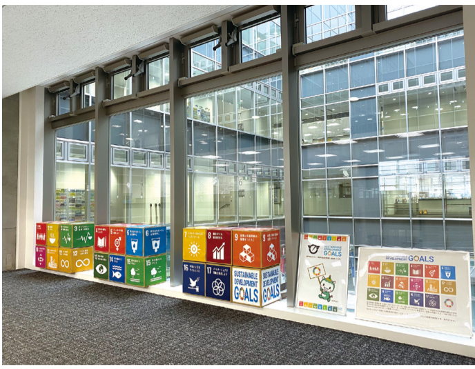
「藤沢らしさ」を未来に引き継ぐ「みんな」で進めるSDGs

本市教育委員会としては、夜間中学の設置を希望する県内17の市町村教育委員会と連携し、二週調査の結果や協議会での検討内容を踏まえ、広域的な仕組みの参画準備を進めてきた。新設する中学校夜間学級の設置に関する検討協議会に参加し、二週調査の結果や協議会での検討内容を踏まえ、広域的な仕組みの参画準備を進めてきた。