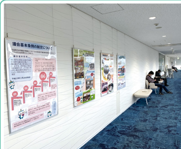
平成を中心とした議会活動を分かりやすく紹介しています

11月から12月中旬まで、藤沢市議会では、市議会の歴史やこれまでの議会改革等の取組について展示を行っています。令和2年から開始した議会史編さん作業において収集した写真資料等を使用し、議会基本条例策定の経過や議会報告会等の活動を紹介しています。あわせて、現在進めている議会史編さん作業に関する写真も展示しています。ぜひ、本庁舎9階展望デッキまでお越しください。御覧ください。