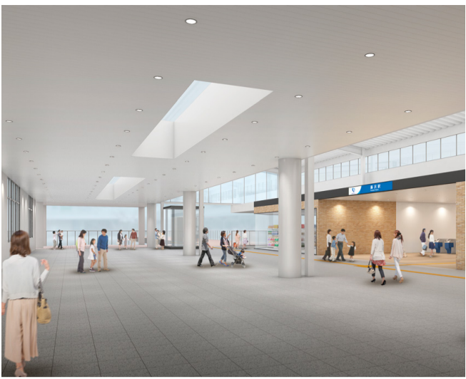
小田急改札口から駅南口を望む第1期施工整備イメージ

本市では、平成19年10月からごみの発生抑制・減量・資源化の促進を目的に指定収集袋によるごみ処理有料化を実施している。 本市においても地球温暖化の影響とみられる気候変動の状況を踏まえ、令和3年2月に藤沢市気候非常事態宣言を表明し、その柱の一つとして2050年までに二酸化炭素排出実質ゼロを目指すことを掲げている。