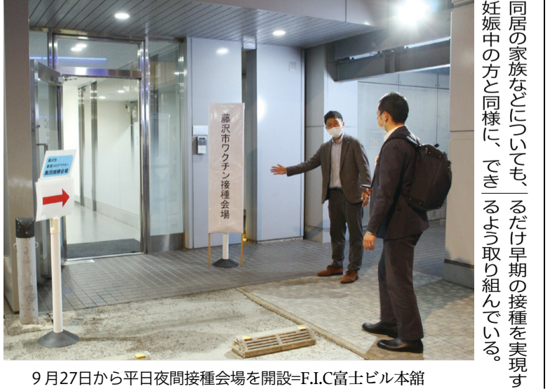
9月27日から平日夜間接種会場を開設-F.I.C富士ビル本館

答弁 新駅周辺地区は、今後の基盤整備を実施した上で、具体的な土地利用が可能となり、時期は新駅開業の前後と想定される。