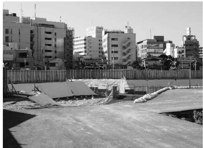
造成工事が進む藤沢北口駅前地区

○藤沢駅周辺地区再整備構想策定に向けた検討状況について 再整備構想(案)においては、藤沢駅周辺の一帯約百四十五分の区域について、地区の特性や都市機能に