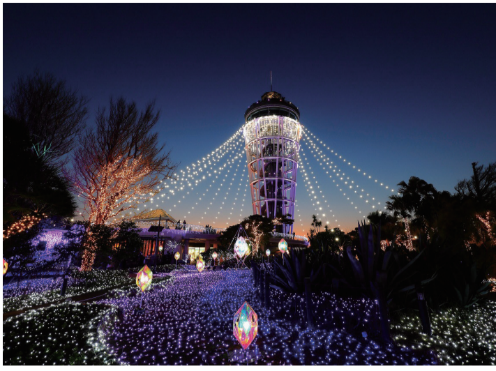
冬の江の島を彩る光と色の祭典「湘南の宝石」

また、使い捨てプラスチックを減らすことも重要と考えており、市の関連イベントでのリユース食器の使用を検討していく。