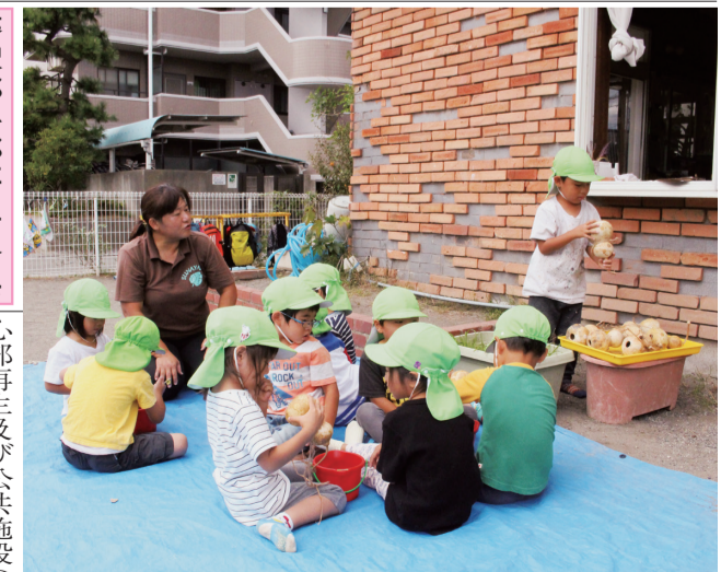
ひょうたんの種抜きをする子どもたち=市内幼児教育施設