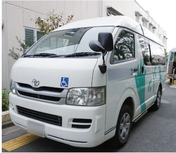
新たな交通手段として期待される民間送迎

また、効果的なインセンティブとするために、例えば、検診に行かない市民の心理を理解した上で、行動の促しを促す、いわゆるナッジ理論を取り入れる先進自治体があるが、本市でもこの理論の研究を進めながら、具体的な仕掛けを検討していく。