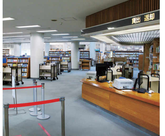
学びや活動の拠点をめざす=総合市民図書館