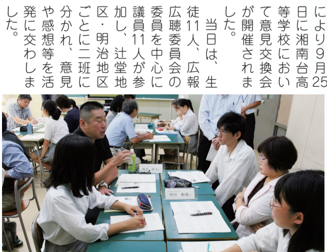
熱心な意見交換が行われた教室

令和元年6月21日に広報広聴委員会から神奈川県立湘南台高等学校に対し、市議会との協働・連携の協力を依頼しました。このことにより9月25日に湘南台高等学校において意見交換会が開催されました。