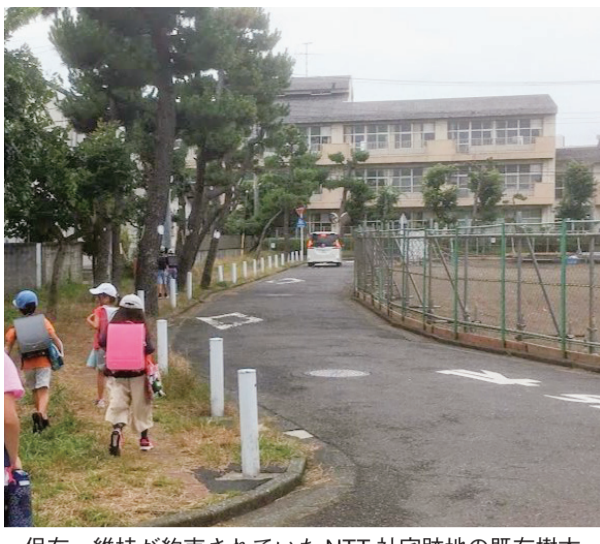
保存・維持が約束されていたNTT社宅跡地の既存樹木

分担のもと、遊水地機能に影響を与えない範囲で実現化をしたいと考えている。また、トイレの設置について、下土棚遊水地上部利用計画案の中で適正な配置が計画されているものと考えている。