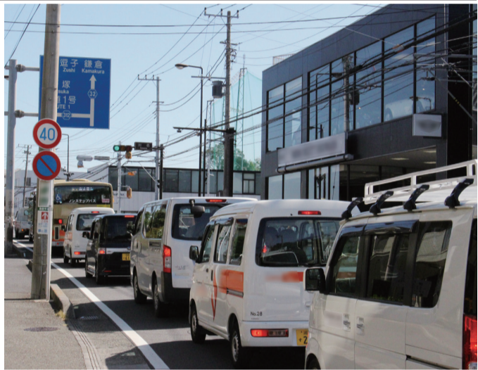
交通渋滞の解消が望まれる県道32号線川名交差点付近

のほか、放課後児童クラブの活動場所、緑の広場、自転車等駐車場などとして活用している。 今後、公有財産規則に基づき、事業着手の見直し等を踏まえ、自治会等と連携を図り、有効活用に取り組んでいく。