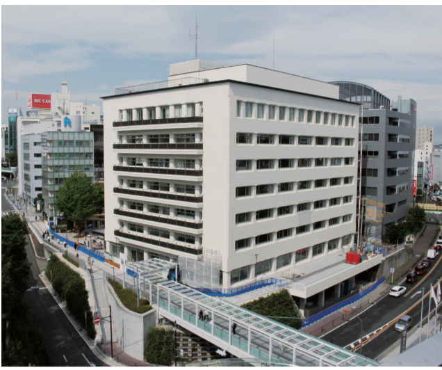
令和2年1月供用開始予定の分庁舎に地域福祉プラザを整備