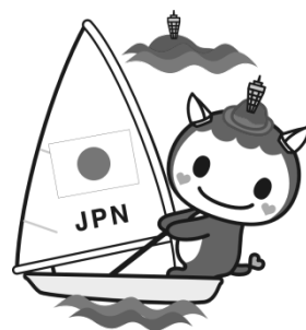
「キュんとするまち。藤沢」 公式マスコットキャラクター ふじキュン♡

下記連絡先へ電話、Eメールまたはファックスで参加者の ①氏名、②電話番号、③希望の部をお知らせください。