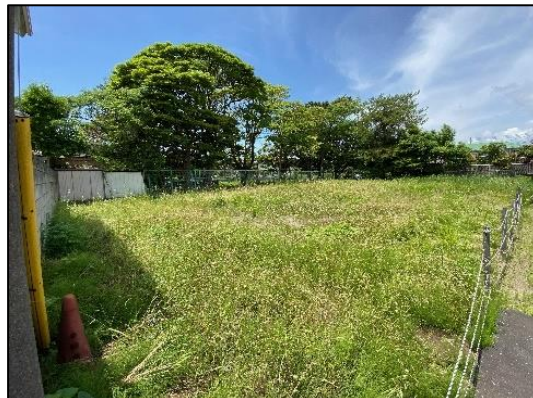
桜小路公園整備対象地