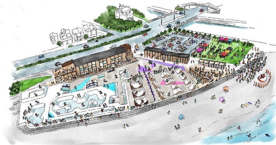
鵜沼海浜公園改修事業 イメージパース（事業者提案）