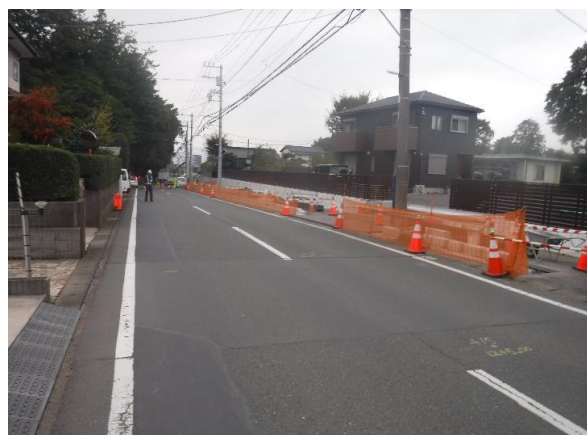
現況写真（宮原百石線）