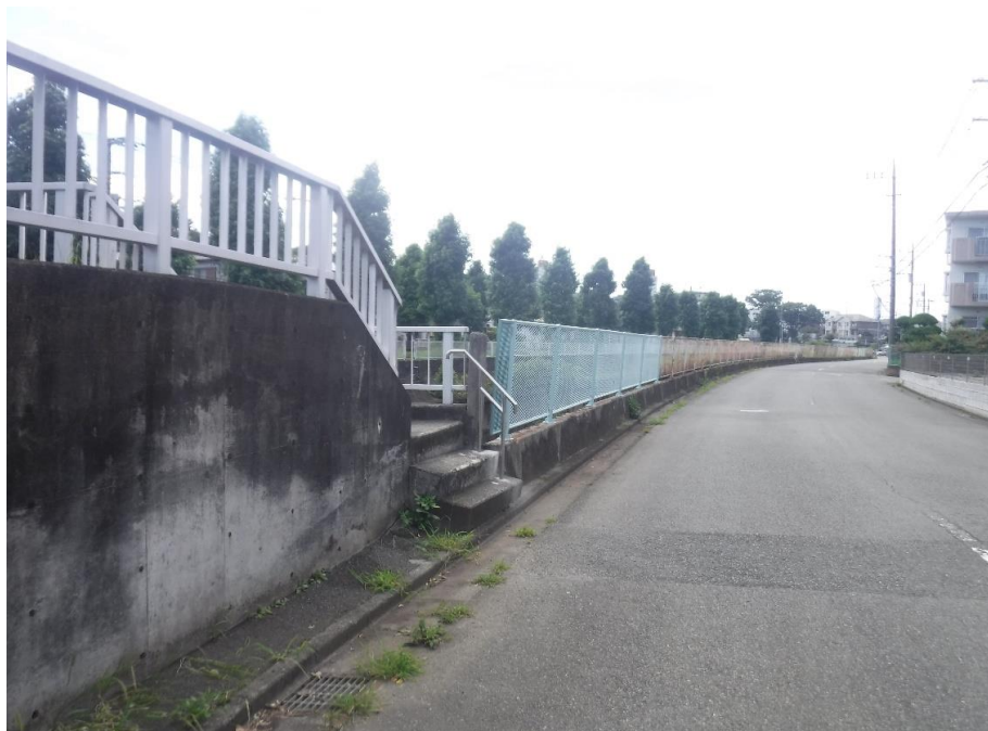
小糸川：左岸（城下歩道橋上流）