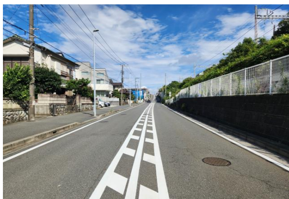
道路区画線標示設置