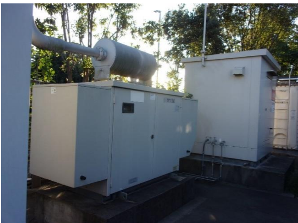
非常用発電機（外観）