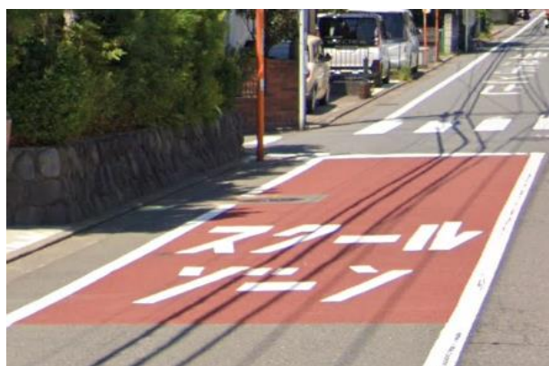
道路区画線標示設置（カラー舗装）