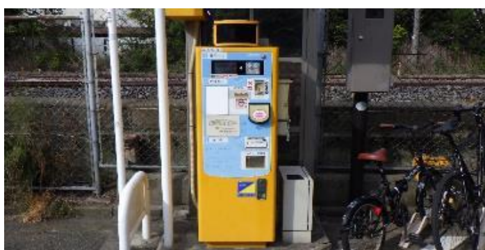
藤沢駅南口路上自転車駐車場精算機