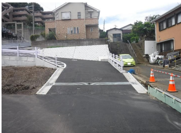
現況写真（藤沢781号線）