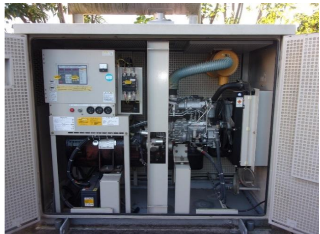
非常用発電機（内部）