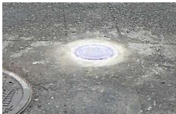
交差点発光鏡設置