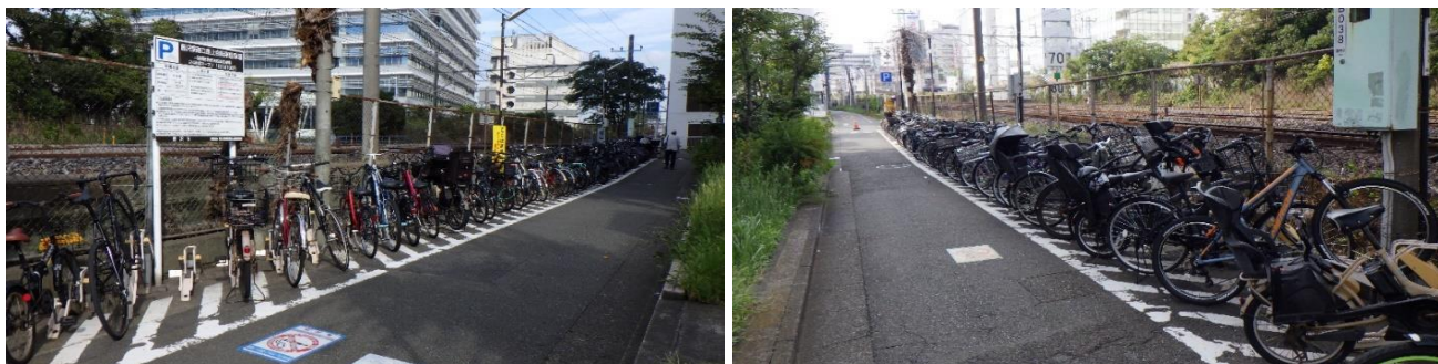
藤沢駅南口路上自転車駐車場