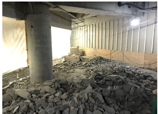
基礎コンクリート撤去状況