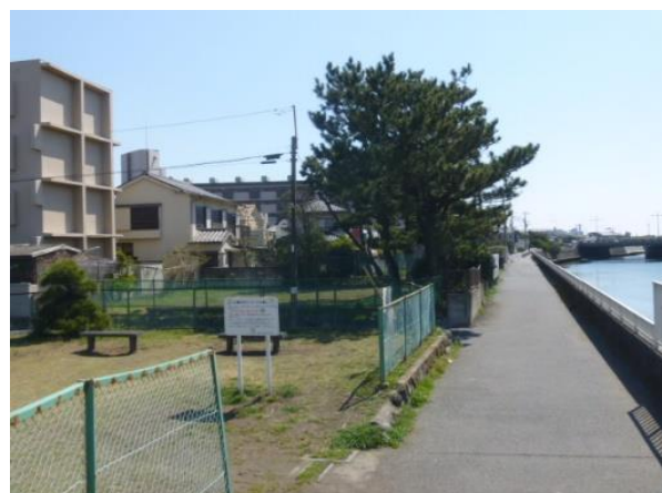
引地川緑地予定地