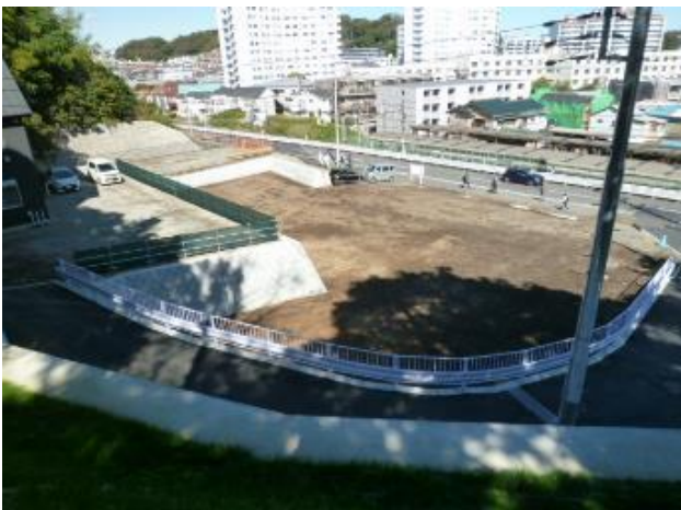
（仮称）藤沢本町駅自転車駐車場