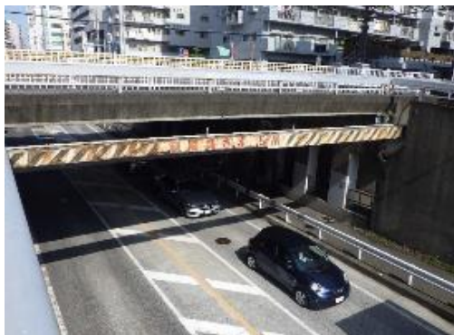
湘南台地区跨道橋（全6橋）