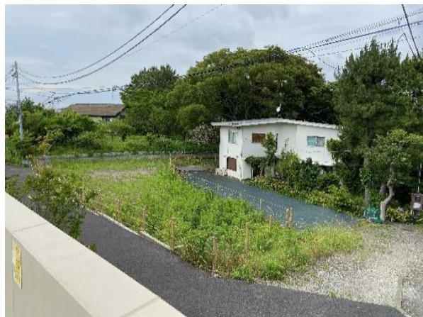
吉野町公園予定地