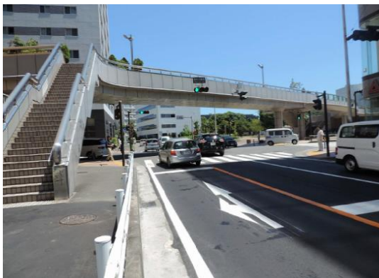
鵠沼歩専道跨道橋