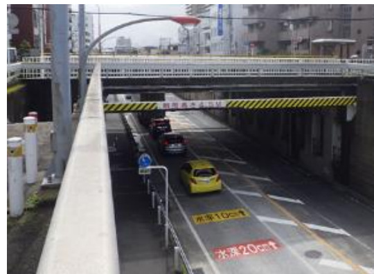
湘南台地区跨道橋（全6橋）