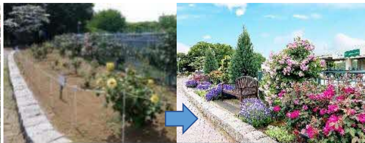
改修したバラ園 before/after（実績）