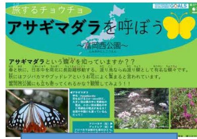
アサギマダラを呼ぶ取組