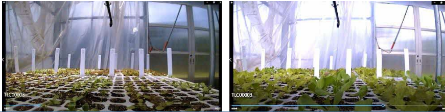
レタスのタイムラプス映像（日中は葉が開き、夜は丸く閉じる動きをします）

遠方や身体的事情等様々な理由で来園できない方々への利用を促進し、またリピーターの方やお気に入りの植物がある利用者には好きなタイミングでその様子を配信していきます。さらに、植物の生育状況を定点観測することで、普段見ることが出来ない時間帯の姿や成長の様子も伝えられ、生物多様性への関心と理解・学習の機会を提供します。