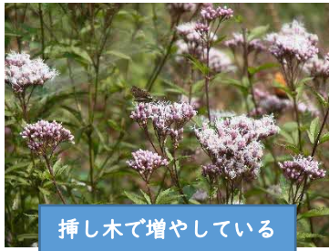
挿し木で増やしている