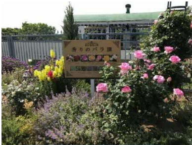
新設した看板（実績）