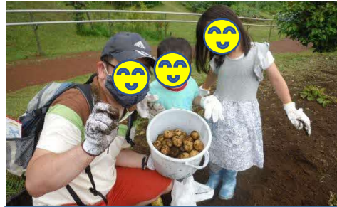
農園付き公園 収穫体験

世代を繋いで公園を訪れる機会をつくる取り組みや、大人が子どものためにできることを数多く提示するなど、公園での活動が自身の生きがいや社会参加の機会となり、価値ある時間を過ごせるよう子どもを中心とした数多くの施策を実施します。その参加者、活動者がスキルアップできるように、多様な主体間の交流を通じて「守り・伝える人」を育て、公園と自然、人が結びついた美しく豊かな生活環境を提供することが当団体の使命だと考えています。