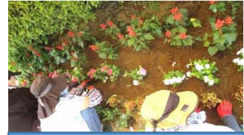
地域協働 花壇づくり

研修会やボランティア活動の募集等により、新規公園利用層、活動層を増やしていく取り組みを行い、市民参加、市民協働の機会を大幅に増加させます。公園内の菖蒲田、水田等の育成・管理を市民ボランティア団体と協働で運営します。