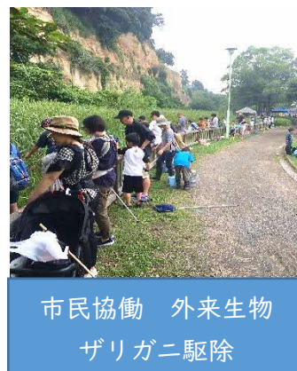
市民協働 外来生物 ザリガニ駆除

指定管理の施設維持・管理業務の主体は「ひと」です。利用者や地域に信頼され、その結果として団体同士の相互理解が進み、参加者や活動の輪が広がっていくことを目指し、地域や利害関係者との丁寧なコミュニケーションを行います。