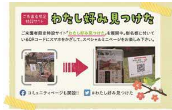
梅の品種ごとにQRコード付き樹名板を設置し、特設ページ（品種の解説）へ誘導（実績）↑

HP上に園内植物の花や葉、実などの写真、開花時期、特徴、栽培方法等を種別にまとめた図鑑を作成します。園内の植物には植物名とHPの植物図鑑とリンクするバーコードを掲示することにより、来園者がスマホをかざすことで植物の情報を見ることができるようになります。