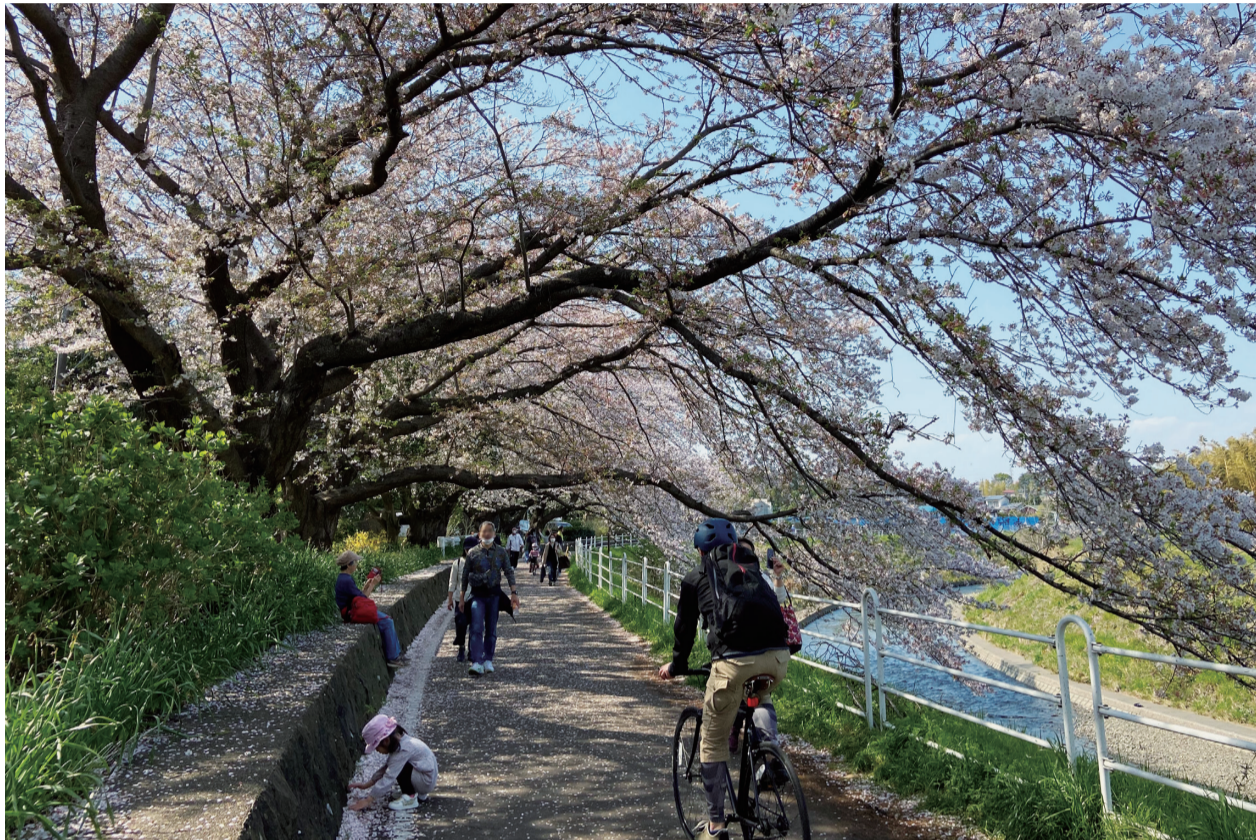
うららかな日差しの中、桜東風に誘われて湘南台境川沿い

この議案は、民法の一部が改正されたことに伴い、保証人が保証する極度額を定める等のため、条例の一部を改正するもの。