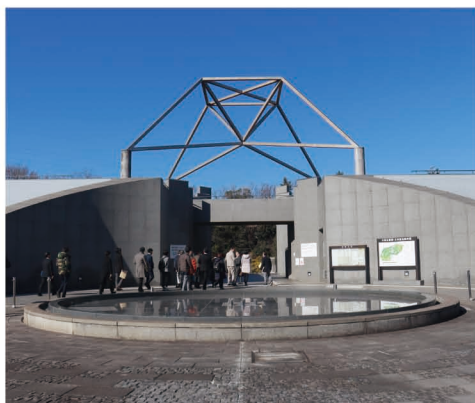
藤沢市大庭台墓園