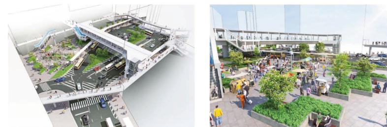
整備イメージ図(藤沢駅南口全体と滞留空間)