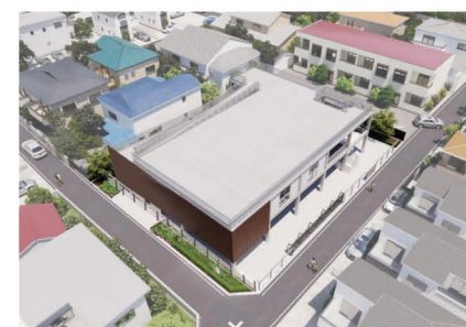
津波避難施設イメージ図