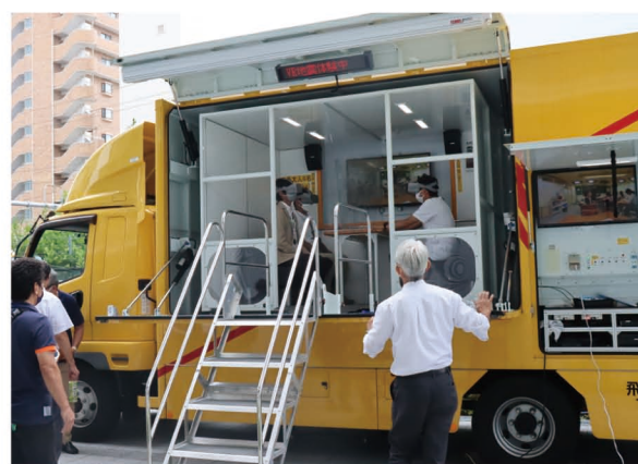
災害対応型の起震車

今後の重点的な取組については、今回の能登半島地震の教訓等も踏まえ、住宅等の耐震化、避難行動要支援者対策を含めた地域防災力の向上と避難対策の強化、備蓄資機材の増強、迅速な復旧・復興に資する受援力の強化など、より一層、市民が安全・安心に暮らしていけるよう、災害に強いまちづくりの具現化に向けて取り組んでいく。【防災安全部】