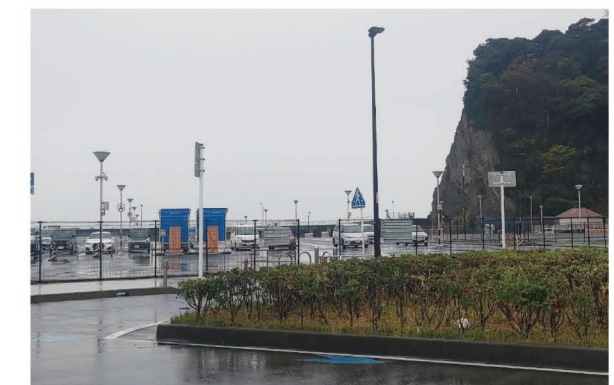
旧かながわ女性センター跡地

跡地については、観光や防災等に寄与する方策を実施するとともに、周辺地域と一体となって広く観光施策を展開することにより、新たな価値を生み出すことができる重要な場所であると認識している。今後は、地元の要望を踏まえた上で、民間企業などの関係機関との連携も視野に幅広く意見を聞きながら、県と協議を進め、利活用に向けた検討を主体的に進めている。【企画政策部】