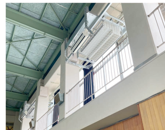
他市の空調整備設置例

今後は、藤沢市立学校施設の次期再整備実施計画の検討内容の一つとして、整備手法やスケジュール想定など具体的な検討を進めていく。【教育部】