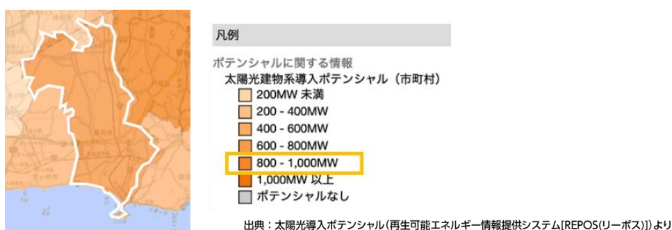
図－1 本市における太陽光建物系導入ポテンシャル