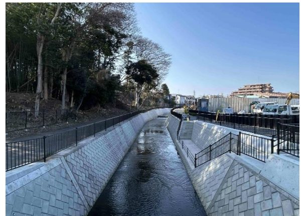
一色川改修事業：稲荷山橋から上流