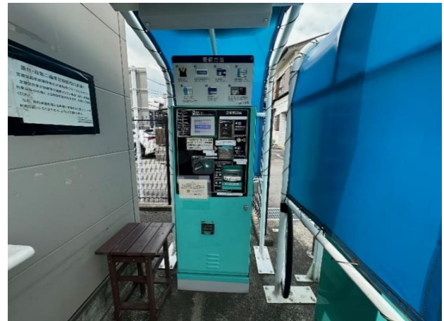
長後駅西口自転車等駐車場