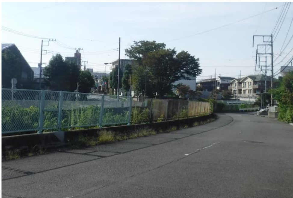
小糸川：左岸（城下橋下流）