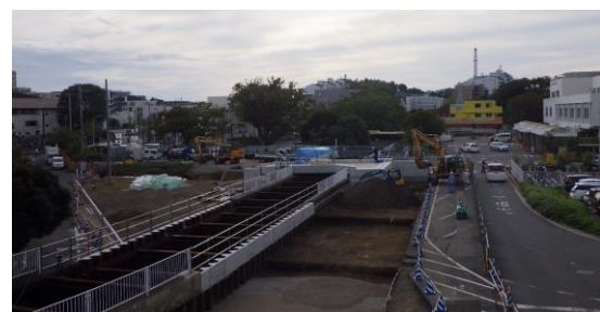
現地写真 (令和7年10月時点)