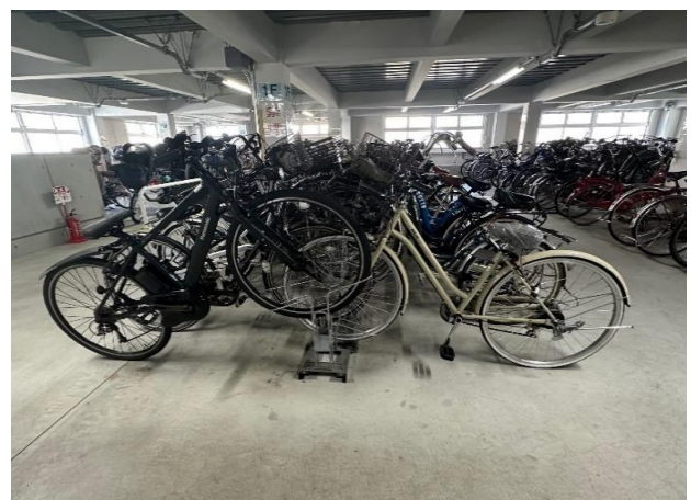
藤沢駅北口第2自転車等駐車場