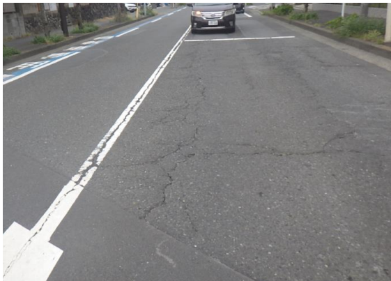
鵠沼海岸線（ひび割れ、わだち掘れ）