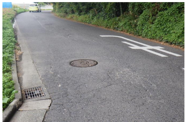
湘南台 1 3 6 号線（ひび割れ、わだち掘れ）