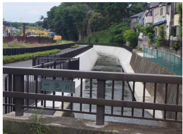
一色川改修事業：下中村橋から下流