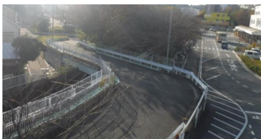
現地写真 (事業着手前)